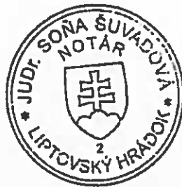
Blanka Fronková zamestnanec poverený notárom